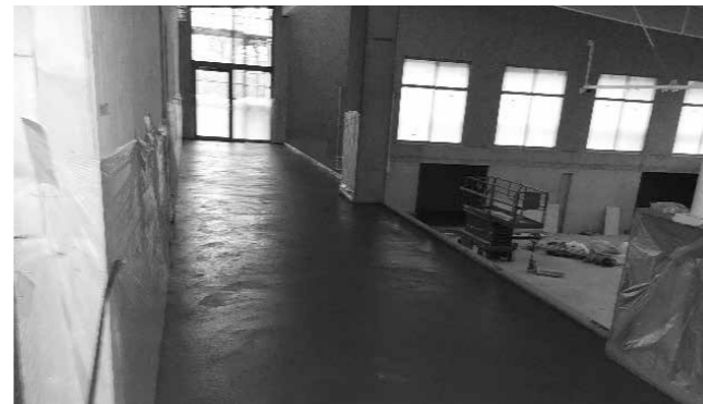
21.04.2023 – der Estrich im Obergeschoss ist schon drin