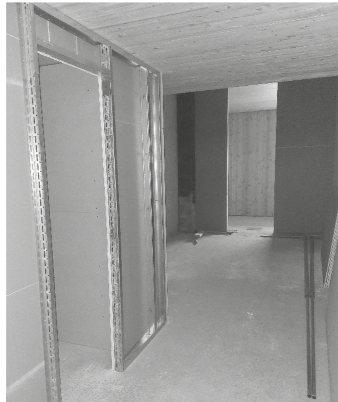
26.02.2023 – ein Blick in die Umkleieräume im OG

Kurz vor Weihnachten konnten wir am 22.12.2022 nach nur drei Monaten Bauzeit bereits das Richtfest feiern. Zwischenzeitlich hat sich wieder einiges getan. Der Innenausbau läuft. Die Zwischenwände im Erdgeschoss wurden gemauert und verputzt, im Obergeschoss die Holzwände isoliert und verkleidet. An der Haustechnik (Lüftung, Heizung, Sanitär) sowie an der elektrischen Installation wird jede Woche weitergearbeitet.