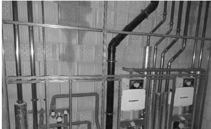
10.03.2023 – viele Rohre sind notwendig für die Heizung und die Sanitäreinrichtungen.