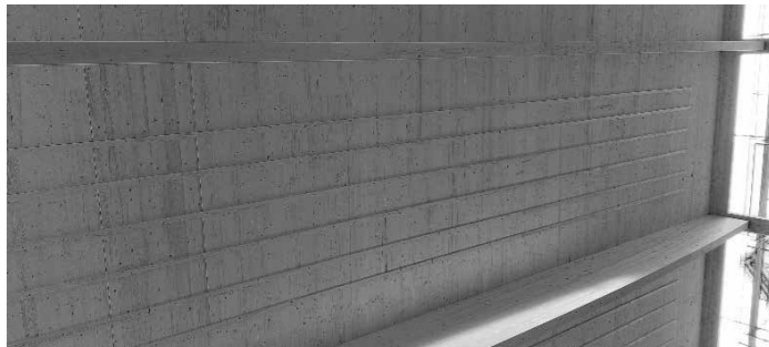
16.03.2023 – Einbau der Unterkonstruktion für die Akustikdecke.