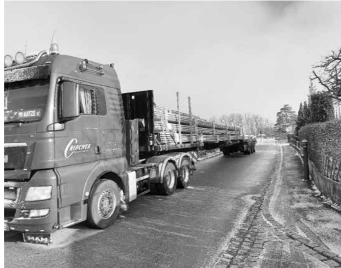
28.03.2023 – als Sonder-Schwertransport wurden in der Nacht die Elemente für das Dach angeliefert