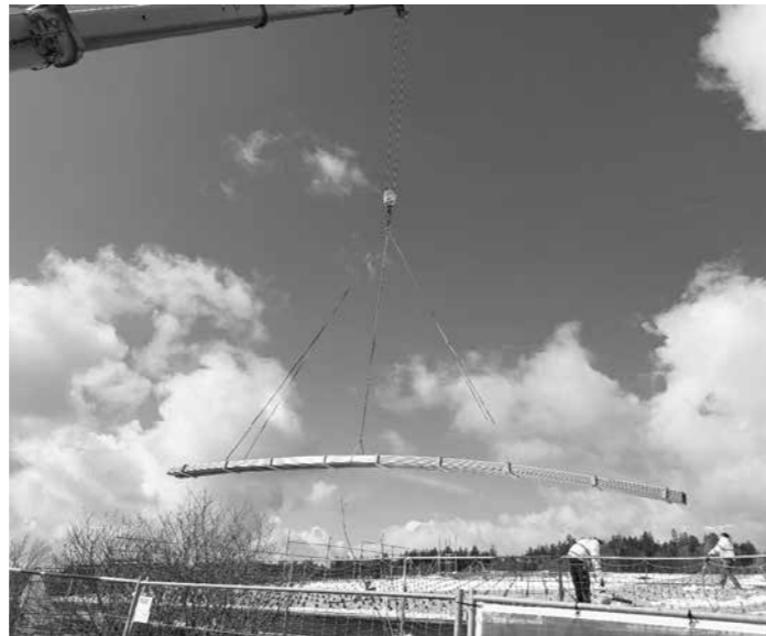
28.03.2023 – und am nächsten Tag abgeladen und montiert. Da es in der Nacht geschneit hatte, mussten am morgen erstmal gut 5 cm Schnee vom Dach geräumt werden.