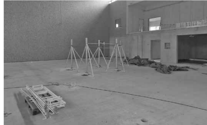
13.04.2023 – Einbau der Bodenhülsen für die Sportgeräte