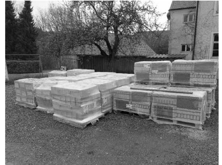
02.05.2023 – auf die Fliesenleger wartet eine Menge Arbeit