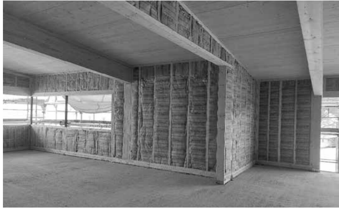
26.02.2023 – der Gymnastikraum im Obergeschoss