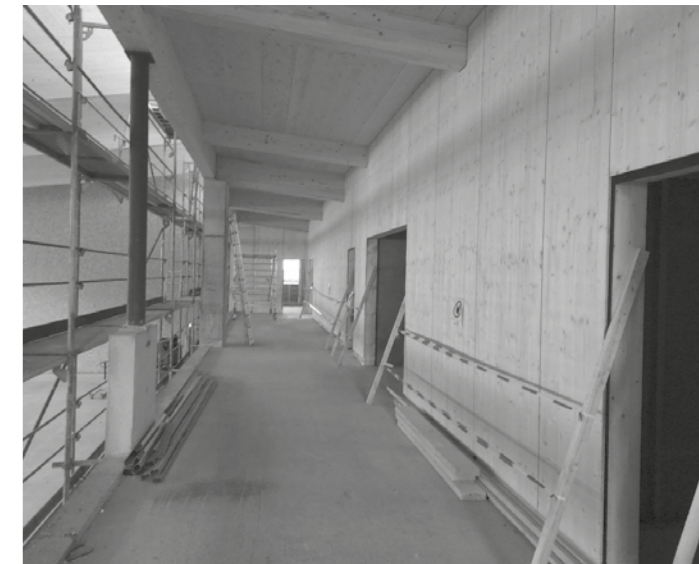
26.02.2023 – Ein Blick in die Galerie im Obergeschoss

Zeitweise herrscht reger Betrieb auf der Baustelle. Sind es doch manchmal 10 – 12 Handwerker-Autos, die vor der Halle ihren Platz finden.